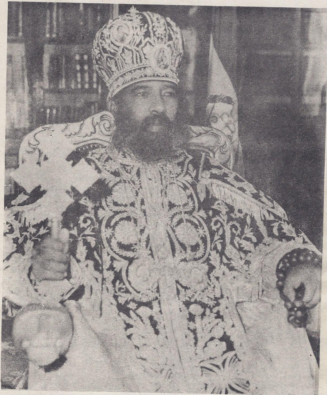
ብፁዕ ወቅዱስ ኦቡነ ጳውሎስ ፓትርያርክ ርእሰ ሊቃነ ጳጳሳት ዘኢትዮጵያ ወእጩኔ ዘመንበረ ተክለ ሃይማኖት