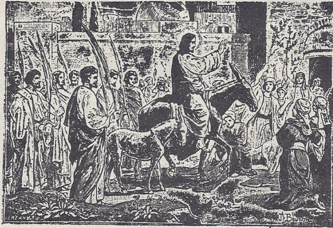
ዘክሙ ፡ ቦላ ፡ እግዚአብሔር ፡ መቅደስ ፡ እንዘ ፡ ይዲቦን ፡ ዲቦ ፡ እድግኑ ፡ (ገጽ ፡ ፳፭ - ፳፮) ።